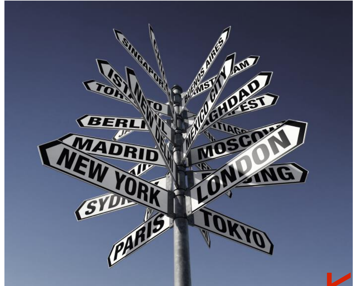
Grundbausteine des Projekts